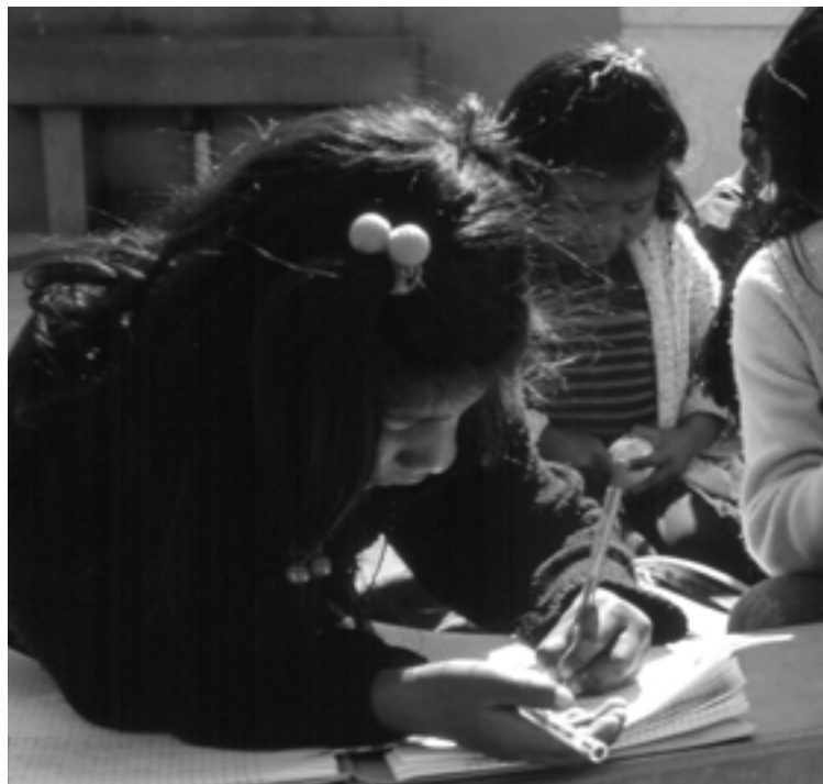
Bolivianska flickor läser läxan. Skolreformerna i Bolivia har lett till att de fattiga barnen får

Det svenska undervisningsbiståndet började med stöd till att bygga skolhus, fortsatte med lärarutbildning och skolböcker, och sker i dag som direkt stöd till utvecklingsländernas egna program för hela skolsystemet.