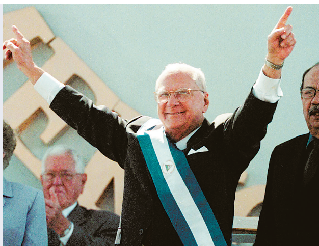
Presidente Enrique Bolaños.

Fuente: Informe Sobre Desarrollo Humano de PNUD 2002