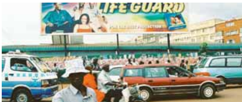
Öppenhet och information är grunden i kampen mot hiv/aids.

24,6 miljoner invånare 50 procent är under 15 år 87 procent lever på landsbygden Läskunnigheten är 68 procent Medellivslängden med aids är 42,6 år Medellivslängden utan aids är 54,1 år Första fallen av aids upptäcktes 1982 2 miljoner har smittats med hiv sedan 1982 900 000 har dött i aids sedan 1982 2,1 miljoner barn har förlorat en eller båda föräldrarna i aids Idag lever 1,1 miljoner (5 procent av befolkningen) med hiv Varje år utvecklar 120 000 ugandier aids